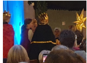
Krippenspiel an Weihnachten 2024 in Niederweimar