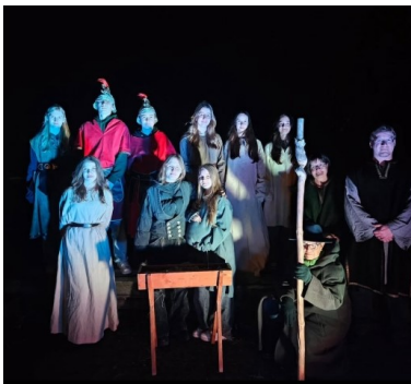
Stallweihnacht in Niederweimar am 4. Advent