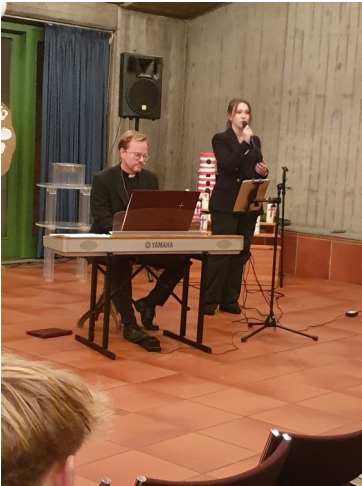
Ewigkeitssonntag in Niederweimar